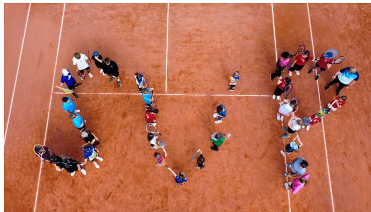
Bild: Tenniscamp_Schnuppertag 2025

Vielen Dank an dieser Stelle allen Eltern und Übungsleitern, die uns beim diesjährigen Tenniscamp sehr gut unterstützt haben!