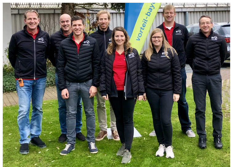
Gruppenbild BTV Turnierteam