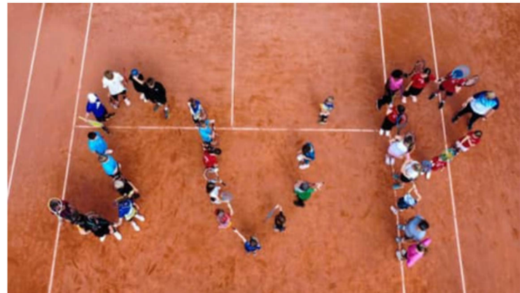
Bild: Tenniscamp_Schnuppertag 2025

Vielen Dank an dieser Stelle allen Eltern und Übungsleitern, die uns beim diesjährigen Tenniscamp sehr gut unterstützt haben!