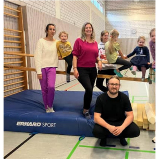
Bild: Betreuer des Kinderturnen im Einsatz

Beim Kinderturnen kommen sogar die Helferinnen und Helfer ordentlich ins Schwitzen – sie machen den Profi-Sprinter*innen ernsthaft Konkurrenz, wenn sie beim „Fangerlens“ versuchen, den flitzenden Kindern zu entkommen!