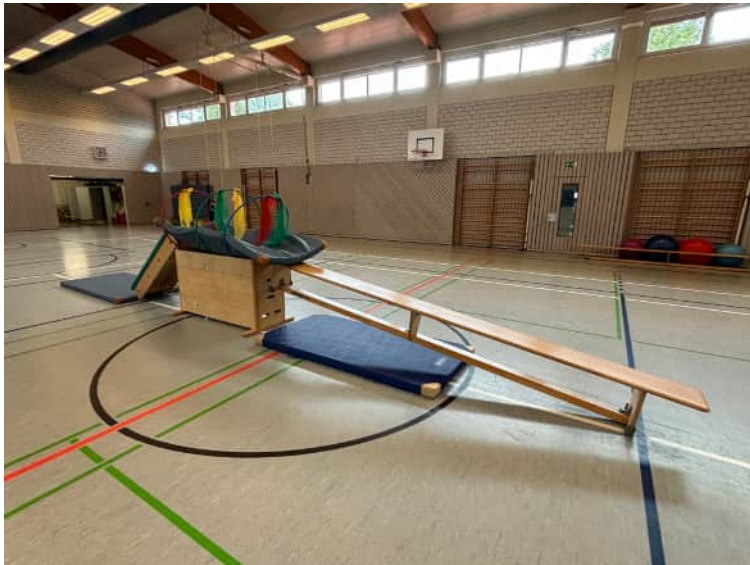
Turnstunde Springmäuse "Regenbogenbrücke"

Nicht nur unser Hauptverein, der SVP, begeht in diesem Jahr sein 75-jähriges Jubiläum: Auch die Gymnastiksparte wurde vor 50 Jahren gegründet. Seit 1974 finden bei uns Sportbegeisterte, vom Kleinkind bis zur Seniorin, ein für Sie passendes Angebot. Darauf kann man im Verein doch stolz sein! Auch in dieser Saison 2023/2024 konnten alle Kurse wie gewohnt abgehalten werden und waren sehr gut besucht. In unseren beiden Kinderturngruppen sind alle Kinder im Alter von 2-6 Jahren herzlich willkommen. Jeden Montag, sowie im Zwei-Wochen-Rhythmus auch mittwochs, erobern 20 „Springmäuse“ und 15 „Grashüpfer“ mit viel Energie die Eichwaldhalle und nutzen das reichhaltige Hallenmaterial. Dabei können sie sich an den unterschiedlichsten Stationen ausprobieren, spielerisch mit einfachen Übungen verschiedene Geräte erkunden und dadurch wichtige Bewegungs- und Wahrnehmungserfahrungen machen. Ganz nebenbei werden darüber hinaus Sozialverhalten, gegenseitiger Respekt und Toleranz gefördert. Besondere Highlights in diesem Jahr waren die „Fahrstunde“, die lustige „Verkleidungsstunde“, das „Abenteuer Wackelhausen“ sowie die „Springmaus auf Futtersuche“.